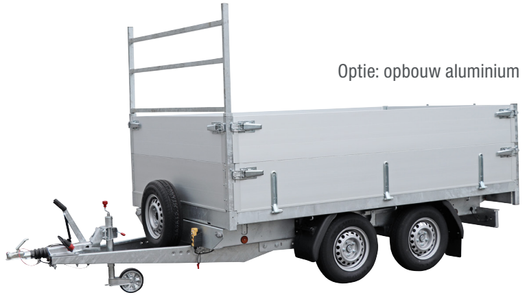
Optie: opbouw aluminium