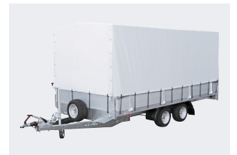
Optie: kader met zeil