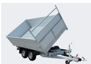
Optie: 3-zijden kippend